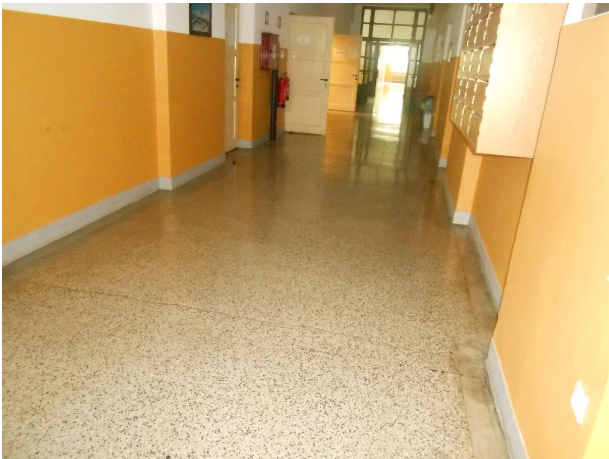
Slika šte. 9: prečno razpokan teraco hodnika

Teraco tlak hodnika v pritličju in nadstropju je razpokan, predvsem v prečni smeri po celi dolžini hodnika, kar je spričo nedilatiranosti pričakovano (slika šte. 9). Te poškodbe, ki načeloma niso konstrukcijske, v nadaljevanju niso obravnavane (lahko pa se jih sanira z urezovanjem dilatacij in polnitvijo s trajno elastičnimi kiti).