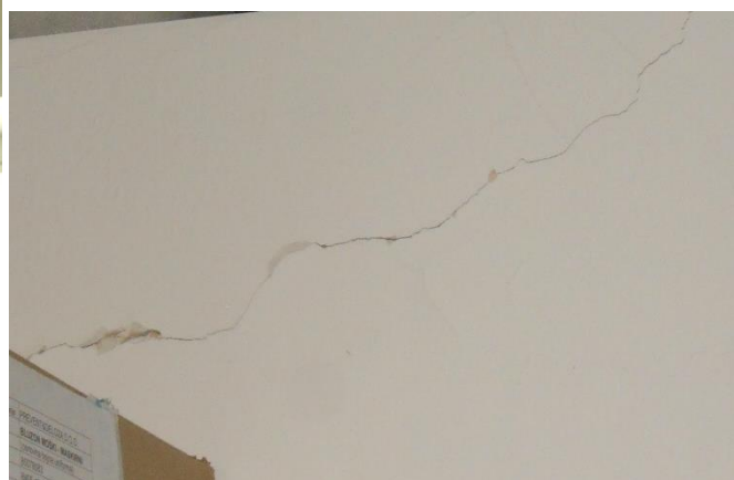
Slika števil. 8: fotografije strižnih razpok zidanih predelnih sten