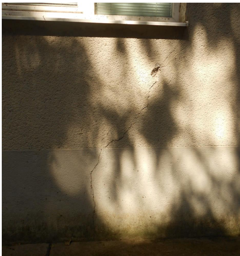
Slika šte. 6: razpoka zidnega nastavka, vzhodna fasada