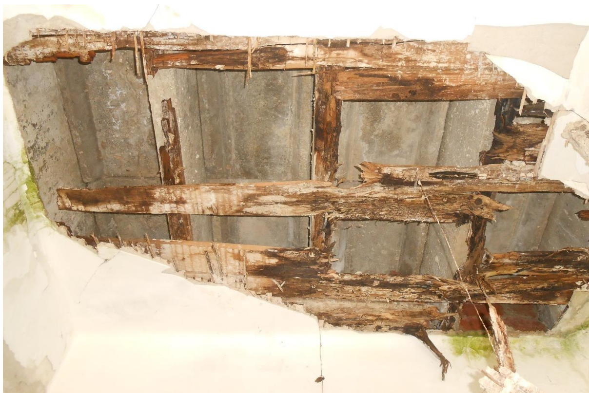
Slika številka 3: zasnova medetažne konstrukcije (fotografija posneta na mestu odpadlega spodnjega sloja v stavbi številka 914)

Na spodnji strani reber medetažnih konstrukcij so (razen mestoma v sanitarijah, kjer je spuščen strop) lesene letve in nanje pritrjen lesen opaz z ometom na trstiki (slika številka 3).