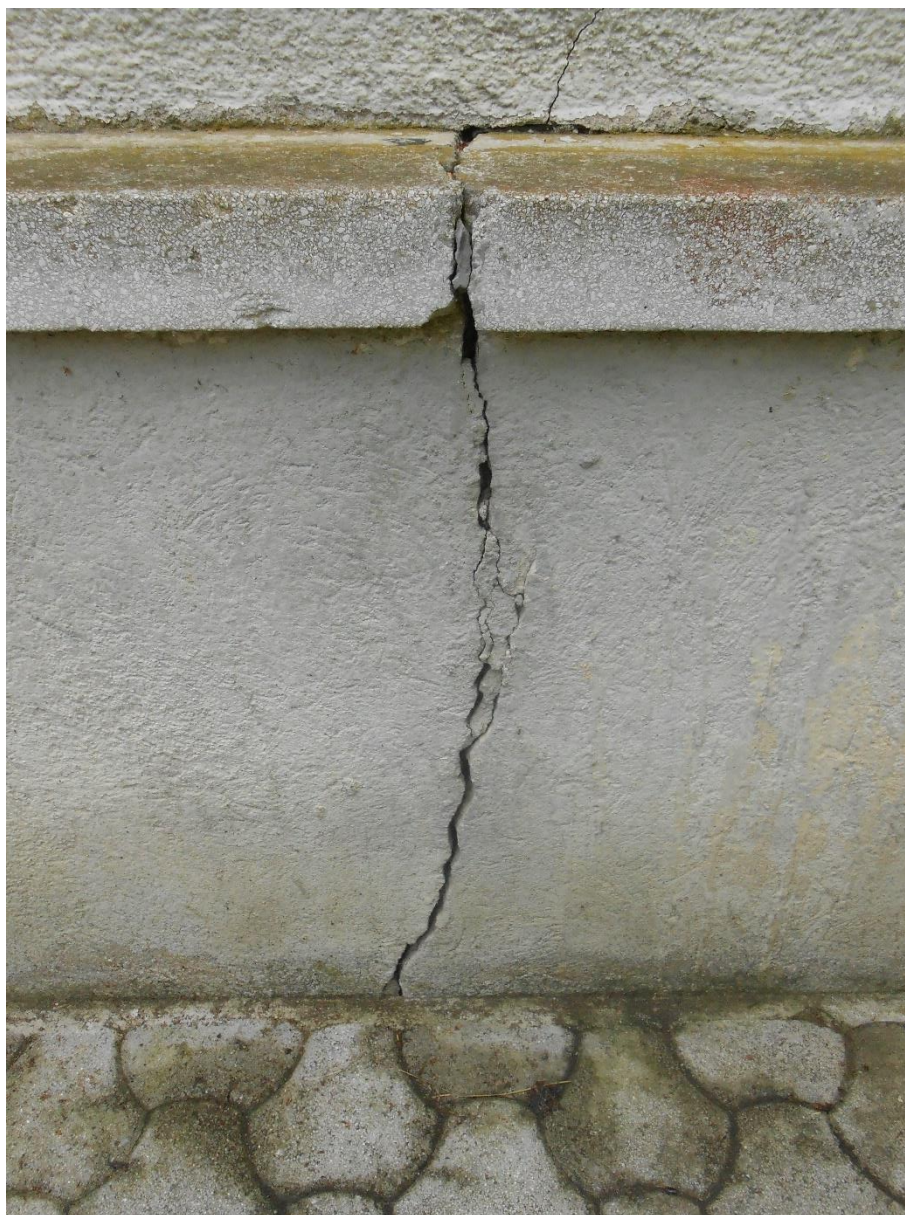
Slika števil. 4: razpoka zidnega nastavka, severna fasada

Domnevamo, da je do diferenčnega posedanja po obodu prišlo med drugim tudi zaradi zamašenih jaškov navpičnih odtokov strešnih žlebov in posledično izpiranja finih frakcij temeljnih tal skozi desetletja.