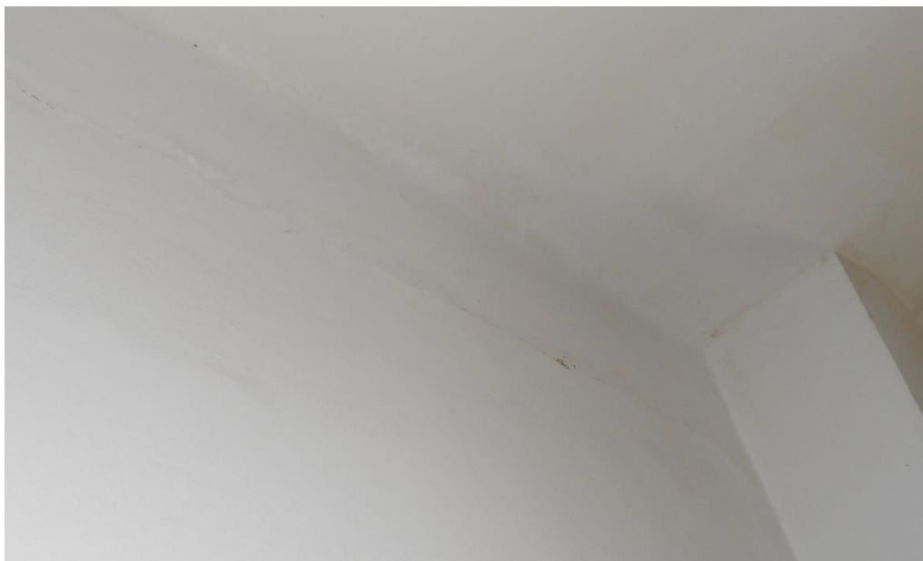
Slika šte. 7: vodoravna razpoka na stiku naknadne pozidave pod nosilcem bivšega stebrišča v pritličju

Na fasadnih površinah so vidne tudi druge nekoliko tanjše in manj izrazite razpoke, kot npr. tik pod streho vogalov na južni strani in na stikih pozidav bivšega stebrišča na severni strani objekta. Istovrstne razpoke so vidne tudi na mestih pozidav stebrišča v notranjosti, in sicer predvsem v hodniku na stiku z zgornjimi nosilci (slika šte. 7).