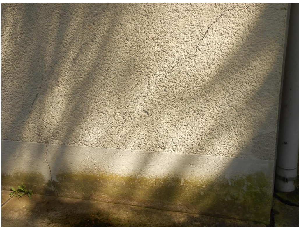
Slika šte. 5: razpoka zidnega nastavka, JV vogal objekta